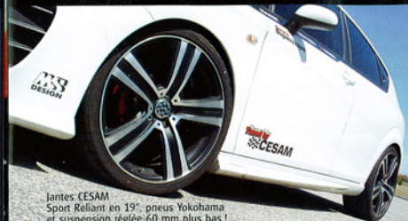
Jantes CESAM Sport Reliant en 19", pneus Yokohama et suspension réglée 60 mm plus bas !