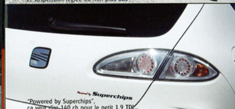
"Powered by Superchips", ça veut dire 140 ch pour le petit 1.9 TDI.