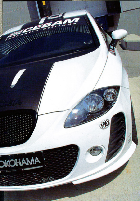
Le kit carrosserie est référencé au catalogue Seat, mais produit par MS-Design, marque distribuée par CESAM.