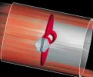
Position clapet fermé Son dynamique homologué CEE